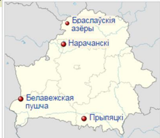
Нацыянальныя паркі на карце Беларусі (памер кропкі прапарцыянальны плошчы тэрыторыі пад аховай)